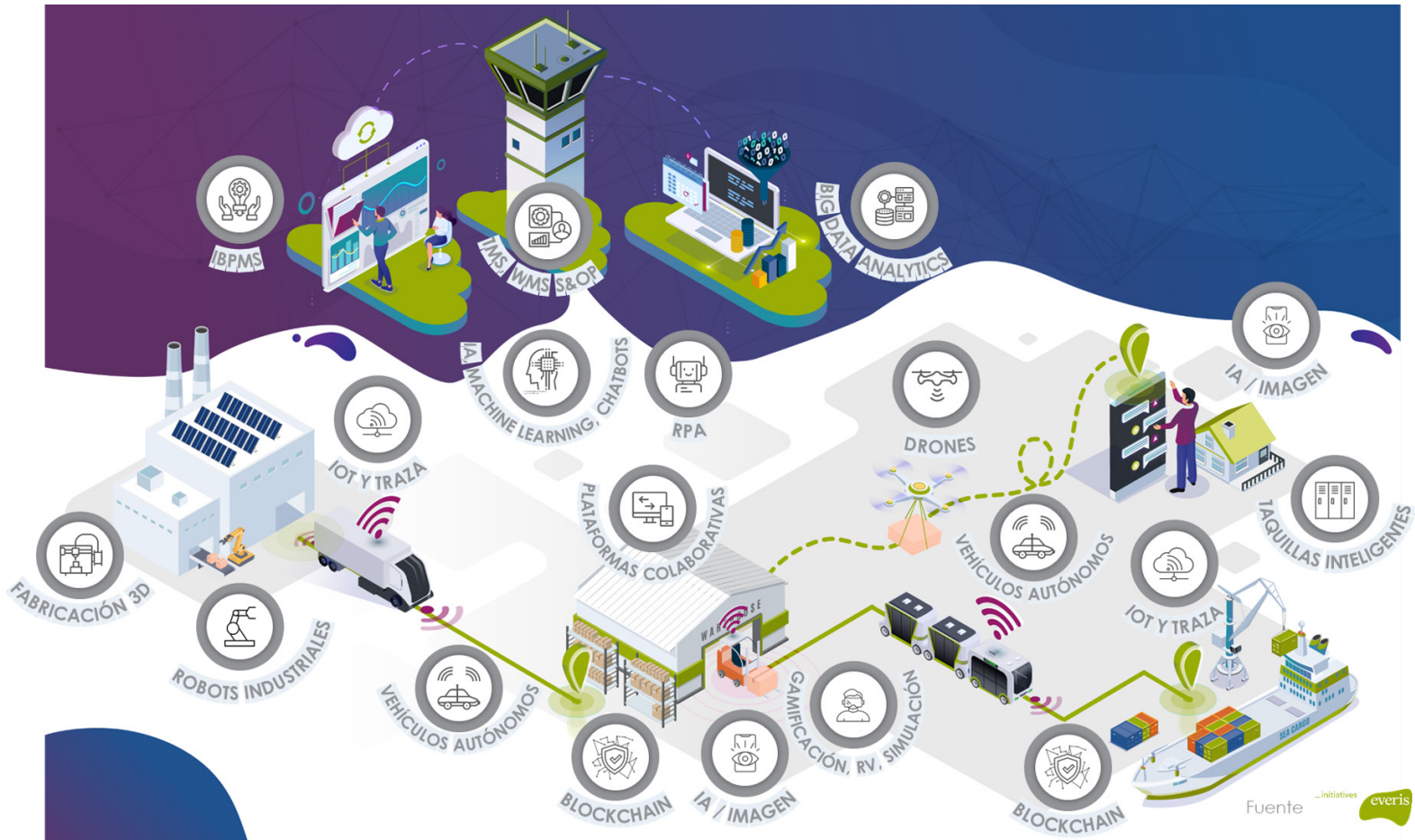
Ilustración 2: Flujo logístico con las tendencias tecnológicas

La tecnología es una herramienta para solucionar un determinado problema, y es por ello que en función de la necesidad se debe utilizar una u otra. En aras de ilustrar qué tecnologías cobran más sentido utilizar en cada fase de la cadena de suministro se ha diseñado esta ilustración de procesos tanto físicos como digitales